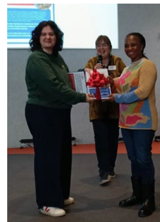
Categorieën Kleine Armoede Hulp projecten

In november 2023 boden de KAH initiatieven een pamflet aan aan Senna Maatoug, Tweede Kamerlid voor Groen Links. Dit werd besproken in de Tweede Kamer en er werd afgesproken dat het kabinet zal reageren richting de Tweede Kamer. Op 20 maart kwam daarom minister Carola Schouten op bezoek bij een groep aanvragers bij KAH.